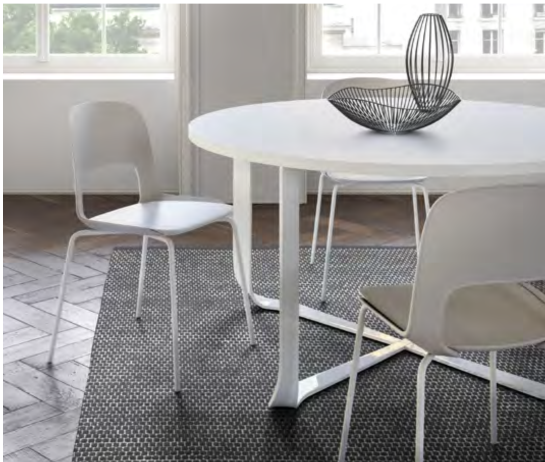
Sedia CORA design Odo Fioravanti

CORA Dalla bellezza del legno, dalla resistenza e flessibilità del poliammide e dalla libertà e versatilità del metallo prende vita Cora, frutto di un connubio materico unico sul mercato.