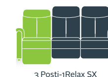
3 Posti-1Relax SX