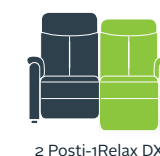
2 Posti-1Relax DX