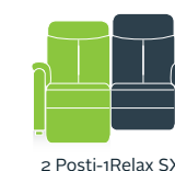
2 Posti-1Relax SX