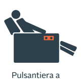
Pulsantiera a bracciolo