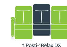
3 Posti-1Relax DX

Optionals disponibili Optionals available Optionals disponibles Verfügbare Optionals