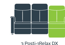
3 Posti-1Relax DX