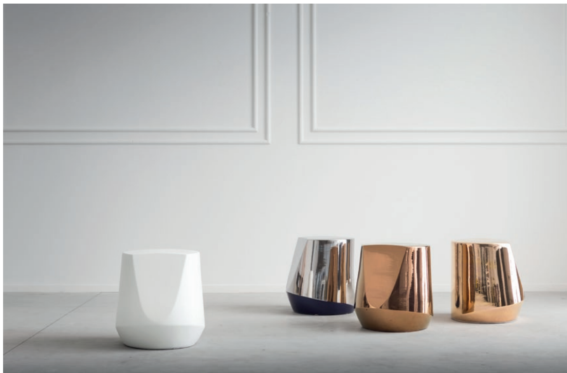
Tavolino HAIK design Emilio Nanni

Haik si presenta come un'armoniosa integrazione di forme geometriche, capace di riflettere e giocare con la luce delle sue eleganti finiture metalliche, ma anche di inserirsi con determinazione in ambienti essenziali nella versione di colore bianco.